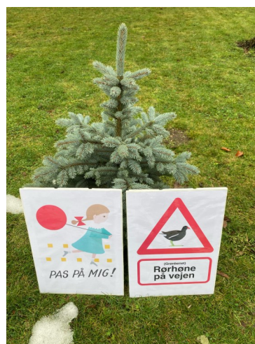
To af de skilte der blev opsat i byen i 2024