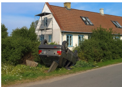
Uheld på Udbygade, august 2010