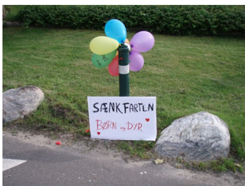
Mange børn lavede skilte til trafikaktions dag i 2007