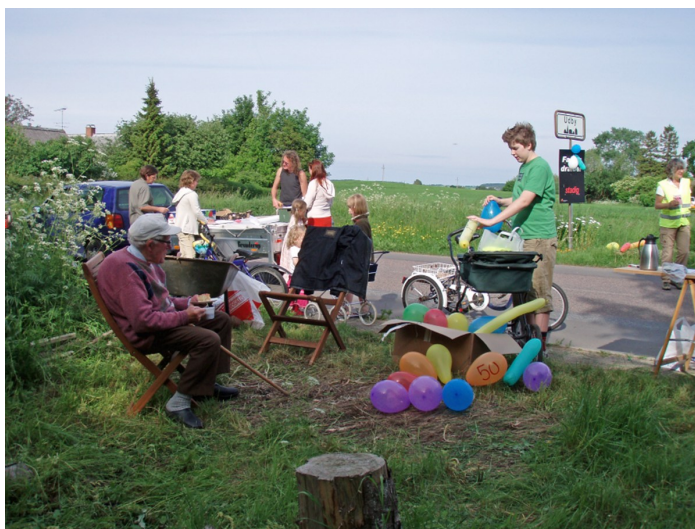
Fra trafikaktionen i 2007 hvor Udby borgere i alle aldre deltog.

Alle veje i Udby er kommuneveje, bortset fra stikvejene med grus. Kommunen kan foreslå fartgrænser, som politiet så skal godkende. Det er Trafiksikkerhedsrådet under Trafik & Miljø i kommunen som står for dette. De kigger på sikkerhed, uheldsstatistik, trafik- og hastighedsmålinger, vejens oversigtsforhold m.m. Du kan se hvem rådets medlemmer er og læse referater fra deres møder på Vordingborg Kommunes hjemmeside under trafik-og-veje/trafiksikkerhed-og-cykelstiplan.