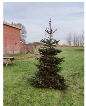
Et hyggeligt juletræ på vandværksgrund