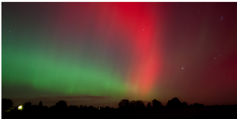
Dette flotte billede af nordlys over Udby er taget af en af Udbys dygtige fotografer, Rob Oldekamp