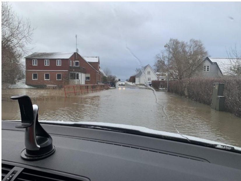
Sådan så det ud i begyndelsen af året i Udbygade

Udby Landsbylaug tog fat i Naturstyrelsen og Vordingborg Kommune med ønsker om at forhindre oversvømmelser. Naturstyrelsen har i juni sørget for gennemspuling af rør fra vores 2 gadekær til grøfterne på Naturstyrelsens matrikel. Efter sommerferien er grøfter og sandfang blevet rensat i Udby Skov. Naturstyrelsens entreprenør (Max) konstaterede slam i grøften ved gadekær syd, og meldte dette til Vordingborg Kommune. Endvidere var der 2 andre steder, hvor T-rørene var defekte. T-rørene er også nu bragt i orden, så vi får mindsket mængden af slam i de åbne