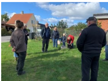
Så starter vi