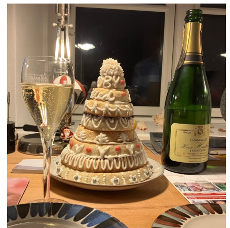
Den smukke og velsmagende kranseskage var flot dekoreret og med teksten "Udby Fælled" i glasur foroven.