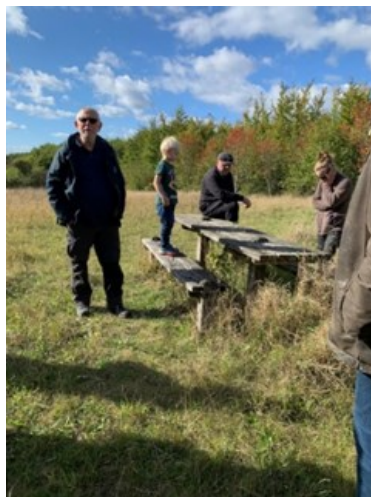
Fra Dirkbakken er der en flot udsigt mod nord. Vi gik videre op til Alices Bakke, hvor vi nød kaffen.