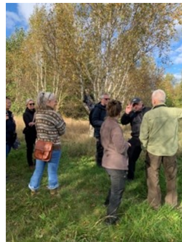
Vi sluttede af i Stilleskoven.