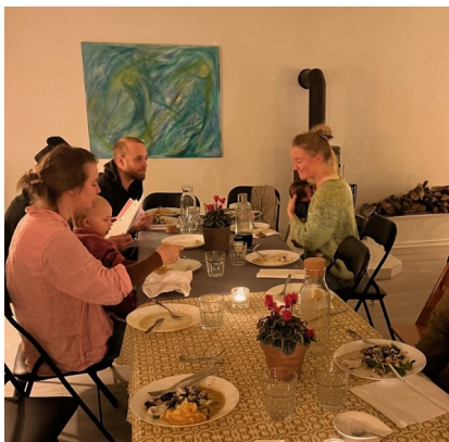
Der var rigtig mange deltagere til både det første hold for børn og deres forældre og til andet hold for dem uden børn. Og dejlig mad til alle.

Onsdag den 20. november prøvede vi et nyt koncept af i fællesspisningen. Efter ønske fra en del børnefamilier flyttede vi spisningen til kl. 17.15 for børnefamilier og kl. 18.30 for de "voksne". Det var et tiltag der blev taget godt imod, da 14 voksne 9 børn og 3 nyfødte mødte op til den første spisning. Efterfølgende var der 24 til spisning, så en stor del af Udbys borgere lagde vejen for-