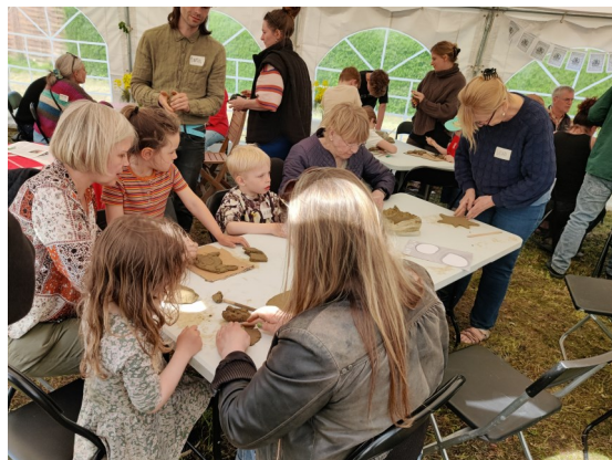
Børn og voksne deltog i workshoppen som var en del af Udby Fælled dag i maj.

Derudover arbejder vi på at udvikle en helhedsplan, der kan opdeles i nogle etaper. Under alle omstændigheder vil proces-