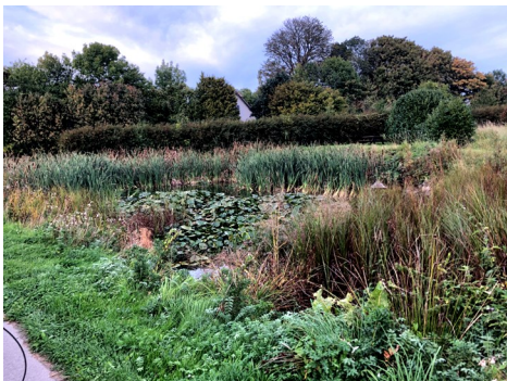
Gadekær nord inden rensning

Torsdag den 28. september blev der fjernet vandplanter fra de 2 gadekær, som begge var næsten groet til. Vi har ventet til ynglesæsonen for vandhøns, frøer mv. var overstået. Det tog ca. 5 timer for vognmanden med kranen at udføre oprensningen.