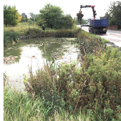
Gadekær nord efter rensning

Vanddybden på det dybeste er nu kun ca. 1 meter i begge gadekær efter oprensning. Gadekærene bliver langsomt fyldt op af næringstilførsel (planter, blade,