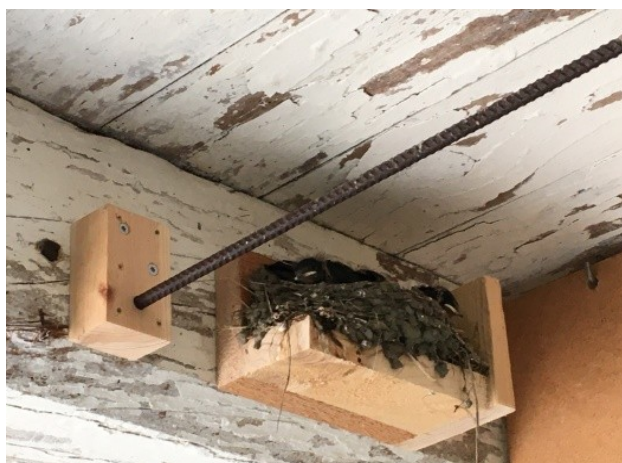
Men Bjarnes hjemmelavede hylde med siddepind er også et godt tilbud.