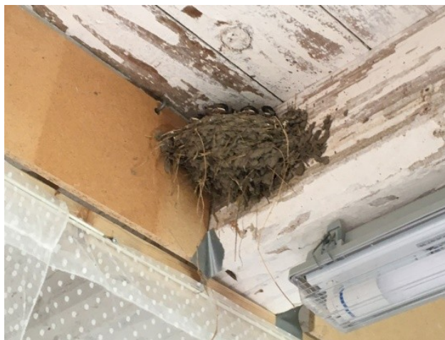
Svalerne finder let et sted at bygge.