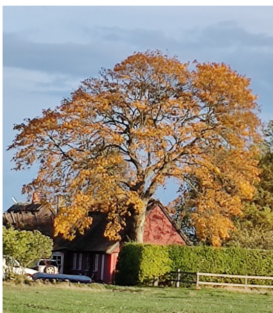
Et af Udbys flotte træer