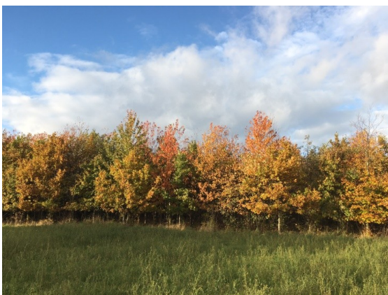
Udby Skov i efterårs pragt