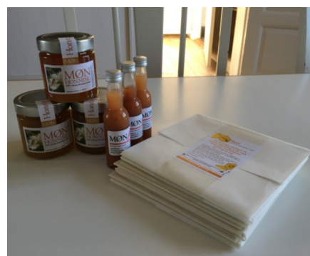
Et udvalg af Mortens mange produkter.

Han har adskillige bistader og høster honning som han sælger. Desuden dyrker han chilier, og laver chilisaucen, som også sælges.