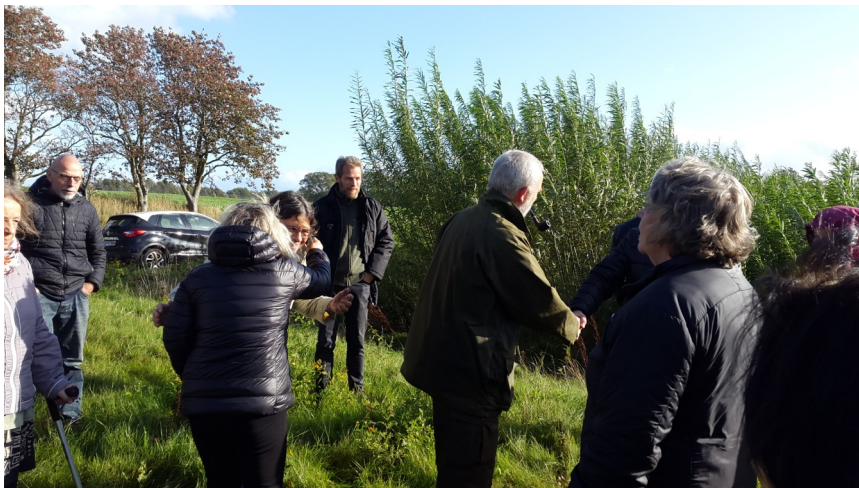
Udby borgere inspicere Røddinges pileanlæg på en smuk solskinsdag i september.

Boligejerne i Røddinge har i fællesskab sikret, både at efterleve kommunens spildevandsplaner og gøre det økonomisk muligt for alle at være med. Måske endnu mere interessant. Projektet har samtidig skabt et landsbysamfund med masser af fællesskab og sammenhold.