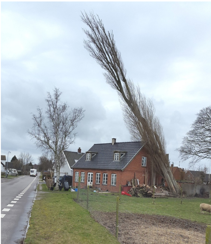
Heldigvis kom ingen til skade - hverken indenfor eller udenfor huset i Udbyvej 27. Kun husets skorsten og bagside af taget var beskadigede.