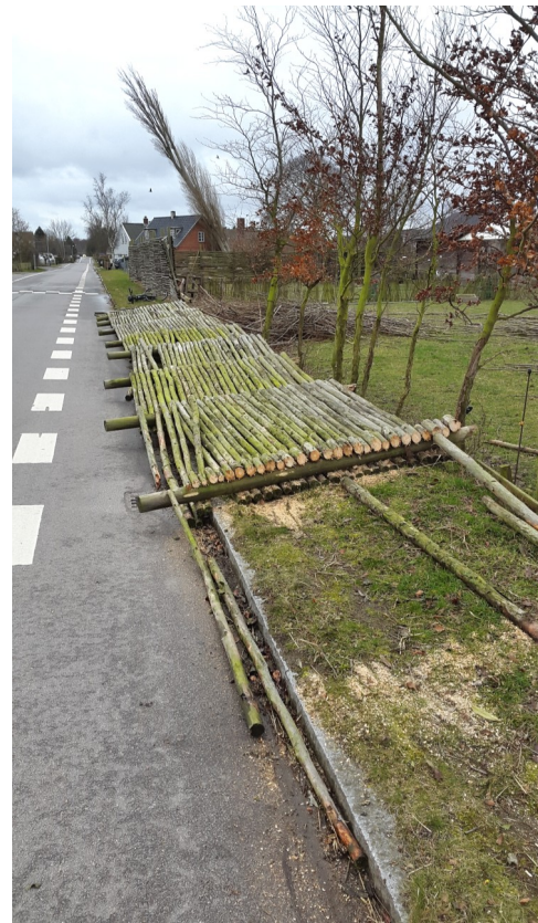
Udbyvej 33 mistede en stor del af deres hegn.

Foredrag den 6. maj i Udby. Se mere på bagsiden!