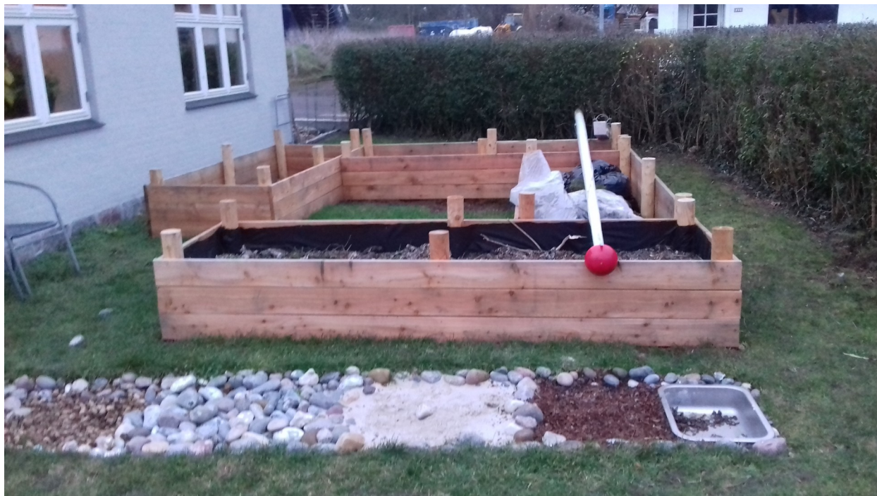
Nyindrettet sansesti i haven ved ny beboer