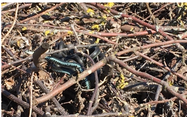
Snoge i vores ris-bunke Helle Hemmingsen

Så i stedet for pertentlig orden og utidig indblanding kan man jo vælge at lade bunkerne ligge og glæde sig over dette mylder af liv.