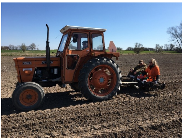
Når disse tre kører ud er det forår.