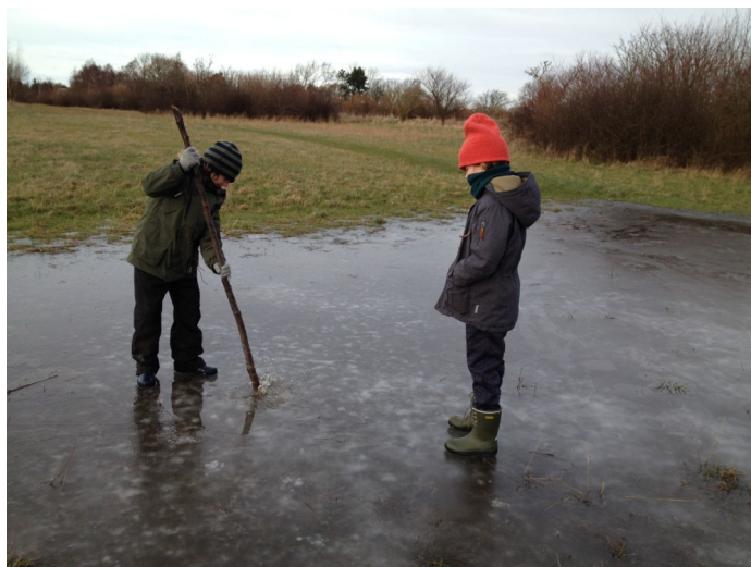
Oversvømmelser og derefter minusgrader gav børn mulighed for at lege på isen i Udby Skov.

En gang om året har kommunalpolitikere møde med alle lokalråd om emner som har betydning for rådene og borgerne i lokalrådets geografiske område. Dialogudvalg 2 har dialogmøde med SOL og de borgere som dukker op den 13. marts 2018 kl. 19-21. Mødet annonceres også i Sydsjællands Tidende.