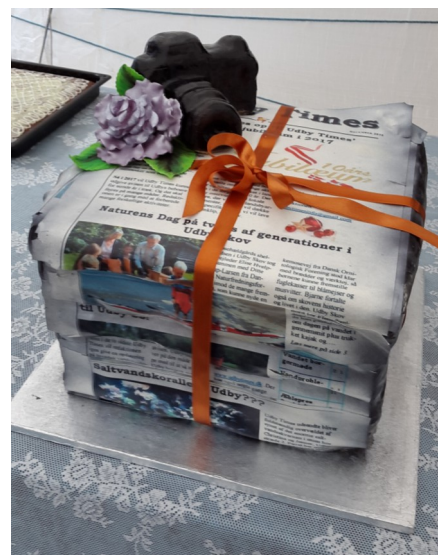
Lagkagen specielt designet til jubilæet.