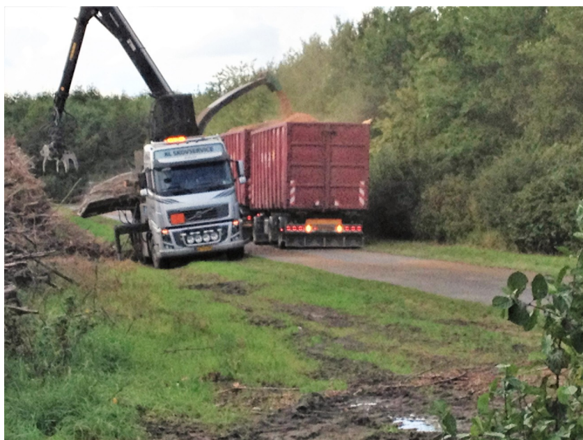
Det tog et par dage for denne monster-maskine at forvandle den store bunke træ langs Dirkevej til flis. Flisen bruges til fyring i varmeværker.

Her er en lille nyhed fra Naturstyrelsen vedr. skovhugst i Udby og Stege Skov: