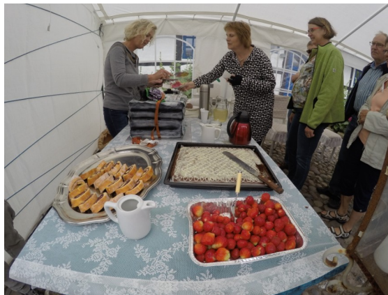
Der var kaffe og kage til alle.