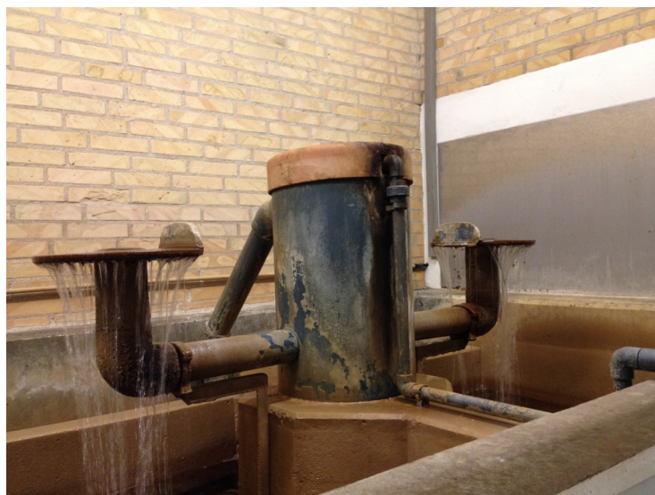
Vandet iltes ved efterfilteret

Bestyrelsen har oplyst Udby Times at de håber at vi snart kommer ind i en længere periode hvor der leveres rent vand til forbrugerne fra eget vandværk.