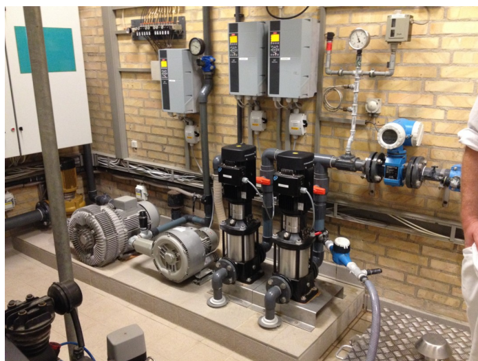
Helle fra Udby Times fik mulighed for at komme indenfor og tage billeder i vandværket.