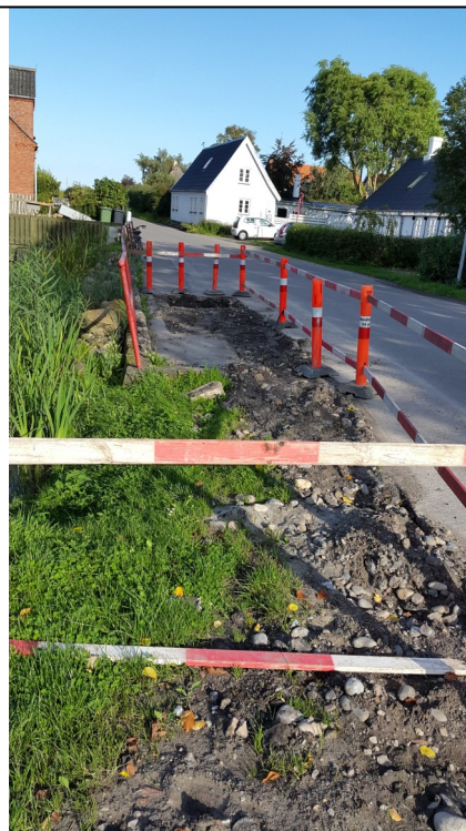
I flere uger har kommunen arbejdet med at afhjælpe afvandingsproblemet i Udbygade. Arbejdet er nu afsluttet.