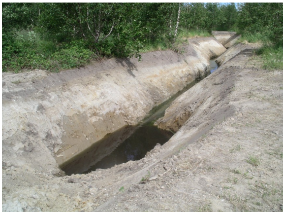
Pas på !! Dybt sandfang. Vi regner med at det bliver sikret.

men når arbejdet er færdigt vil entreprenøren jævne arealet, så der igen bliver farbart på stierne. Når græs og blomster atter vokser frem, kommer det vel til at ligne sig selv igen.