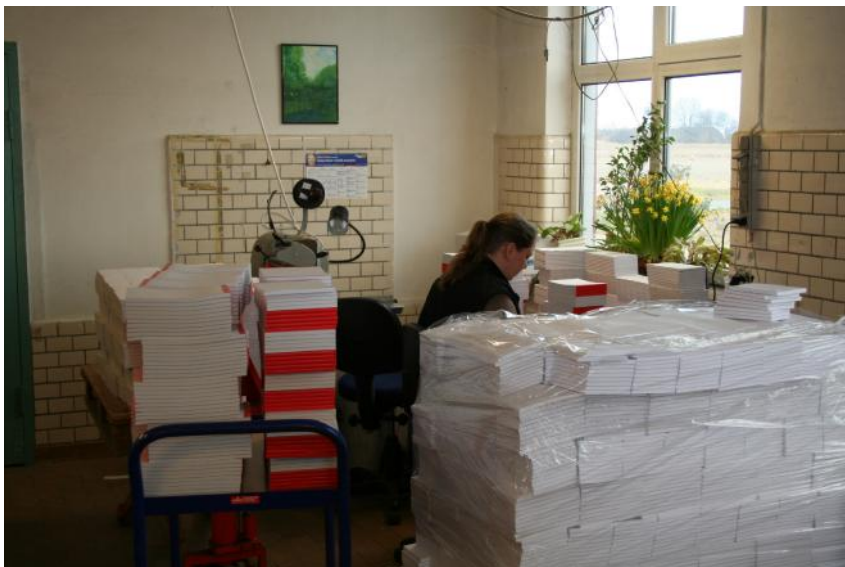
De har travlt på Rødled Papirindustri for at følge med bestillinger på deres papirprodukter