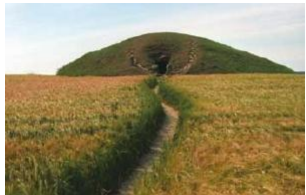
Kong Asgers Høj