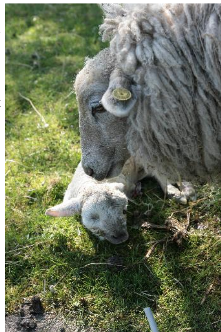
Forårstegn i Udbygade 13

Læs om de mange kommende arrangementer for landsbyens borgere fx Affaldsindsamlingsdag, visionsmøde, sommerfest og meget mere.