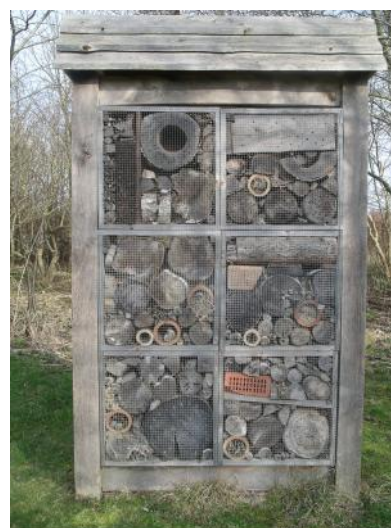
Insekthotellet på Mosehældplads