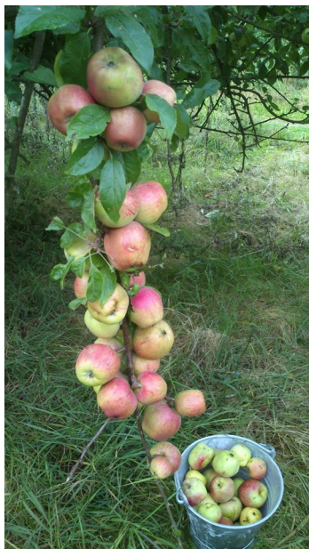
Æbler i Udby Skov findes med boskoi