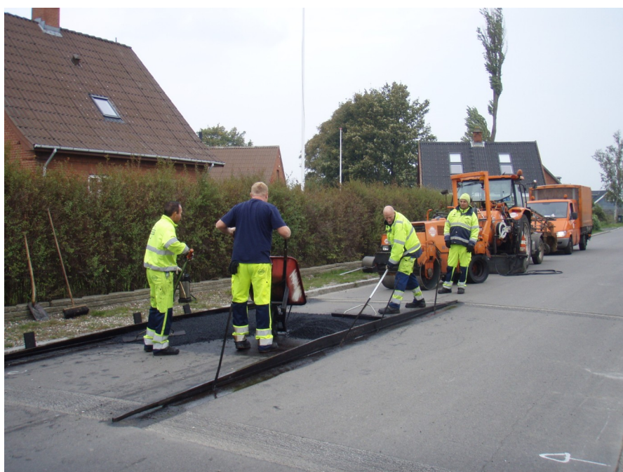
Den 7. oktober kom et hold mænd med maskiner for at anlægge bump på Udbyvej