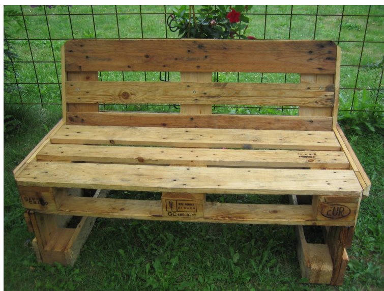
En god og billig løsning på en pallebænk