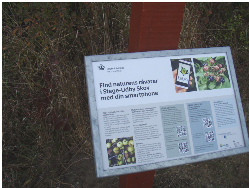
Skilt ved indgang til Udby Skov ved Kirkemosevej

Som tidligere skrevet i Udby Times har kommunens afdeling for Sundhed sammen med folk fra Udby og patientforeninger og Møn skole registreret spiselige planter i skovene ved Udby og Stege igennem et projekt kaldet "Naturens spisekammerlige i lommen".