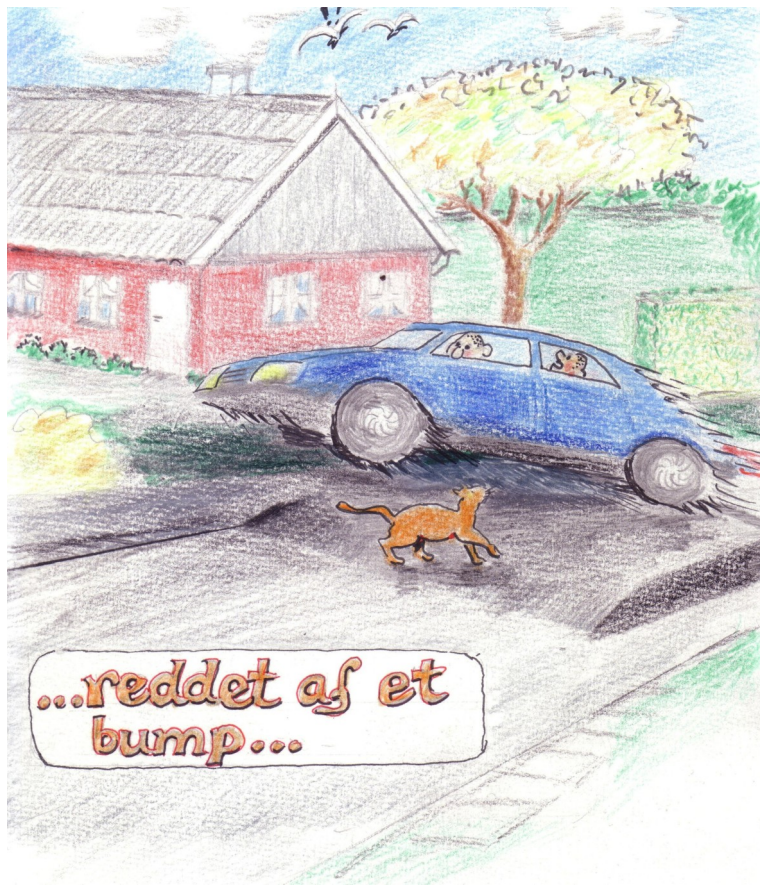
Tegning: Flemming Schmidt

Jón Petersen oplyste også, at bumpene er dimensioneret til 40 km/t