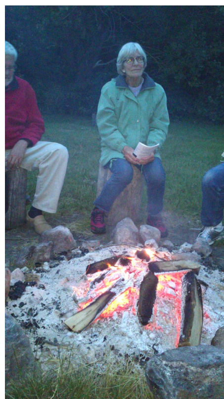
Der blev sunget rundt om Skt. Hans bålet på Mosehældgårdspladsen den 23. juni i år. En ny tradition blev måske grundlagt?