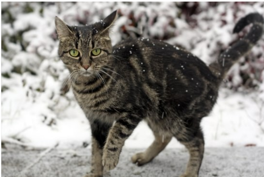
Herreløse katte fryser

Udby Times vil over de næste par udgivelser belyse situationen med de vilde katte i Udby Skov og de muligheder der er for at afhjælpe problemet.