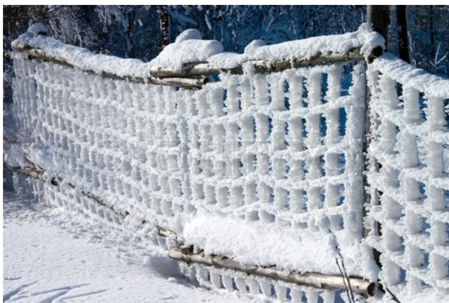
Eksempel på snehegn

Dan og Jettes ide er at samle genbrugsmateriale i landsbyen for at holde prisen nede og købe resten for penge indsamlet i landsbyen. Der skal selvfølgelig indhentes tilladelse fra ejeren af marken og