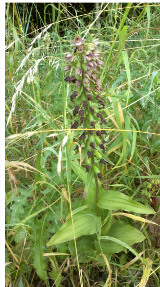
Orkidé i Udby Skov