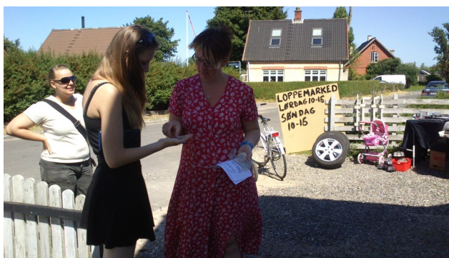
To huse i Udby holdt loppemarked samme weekend i sommers. Her ses en indgået handel.