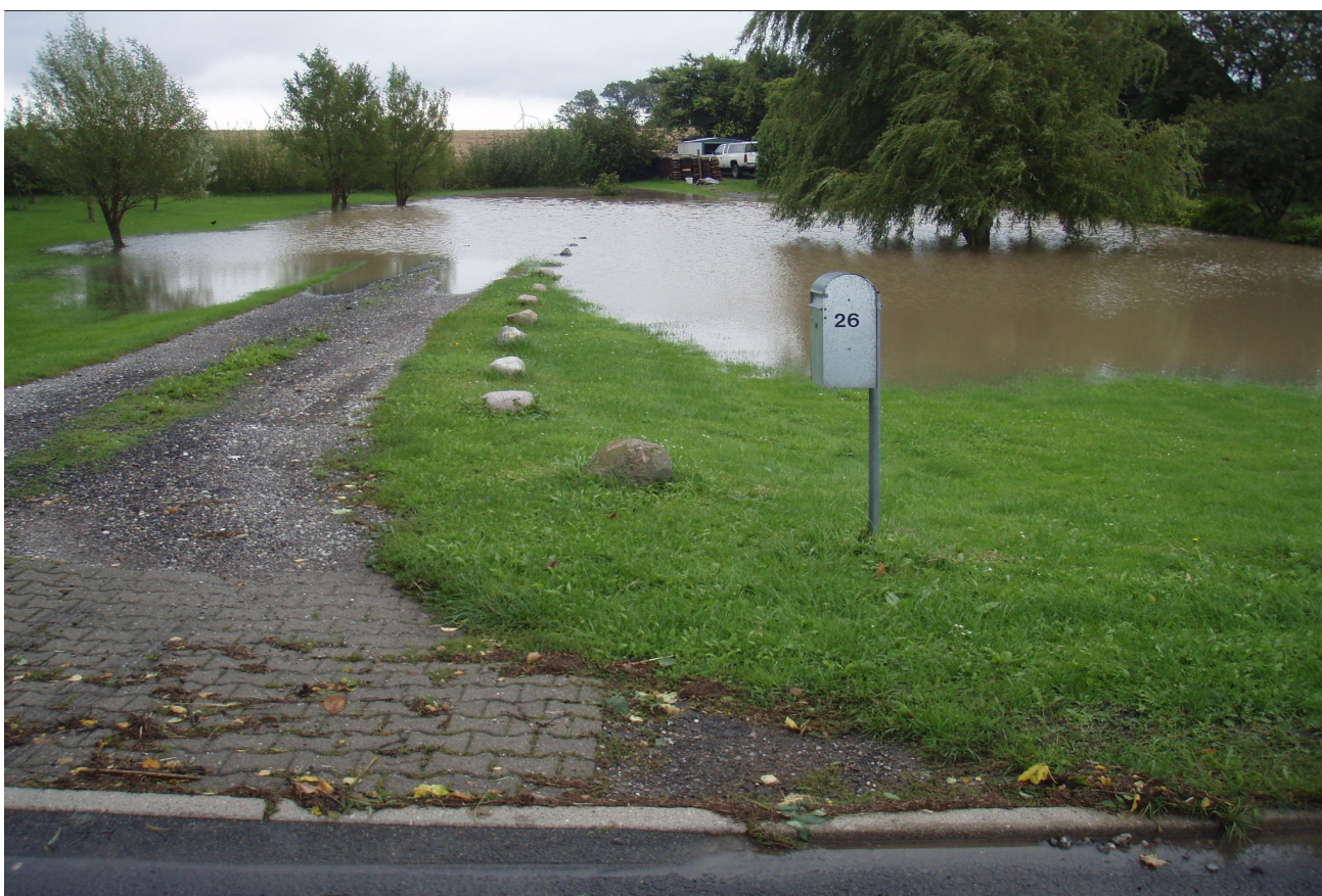
Oversvømmelse på Udbyvej 26.