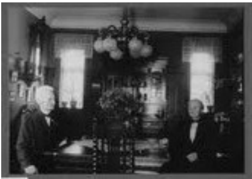
Bedstefar og bedstemor i huset i Charlottenlund 1943