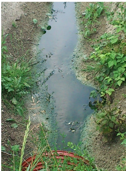
Stillestående vand og grøn algevækst ved Bodshøjvej, sommer 2012

Indsigelsen og kommunens svar på indsigelsen og det godkendte reguleringsprojekt ligger kopieret i en mappe i Wedeles Hus