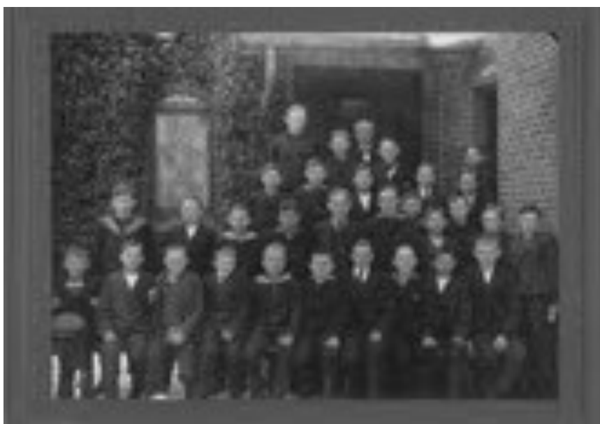
Oles far øverst til venstre. Stege Skole 1919

efter ham. Vi kørte ind ad en markvej, passerede en ruin og drejede op mod huset: Jeg var solgt og min kone var solgt. Så bad vi mægleren om at komme, så vi kunne se nærmere på huset.