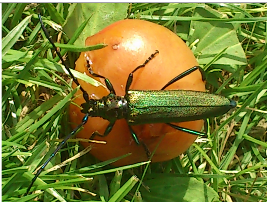
Så er det tid til at nedfaldsfrugten bliver nydt af vores mangfoldige og flotte insekter