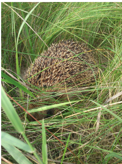
Natur i baghaven ved Bodshøjvej

Mange udtrykte glæde over at få avisen og læse om Udbys liv. Avisen vil stadig være tilgængelig for alle på nettet på www.udbytimes.dk .