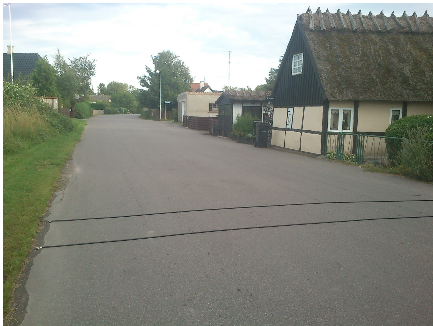
Trafiktælling i Udbygade.