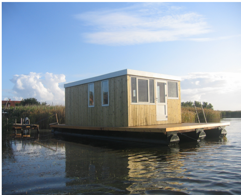
Kurts husbåd færdigbygget og for svaj ved Nyord havn

alt blev bygget på Nyord. Kommer du en tur til Nyord kan du også se husbåden som ligger på svaj med et anker og flyder ude på vandet.