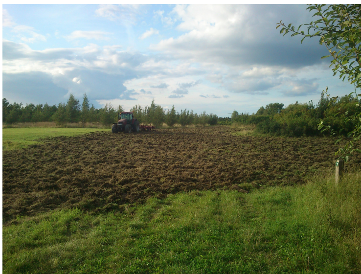
Mellem Kirkemosevej og Bodshøjvej bliver græsstien nu mere jævn