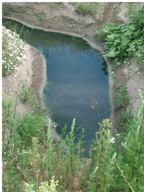
Algefylt vandrende med grøn frø ved Bodshøjvej

Storegade 29 • 4780 Stege • Tlf. 55 86 15 00 • Fax 55 86 15 55 www.moensbank.dk