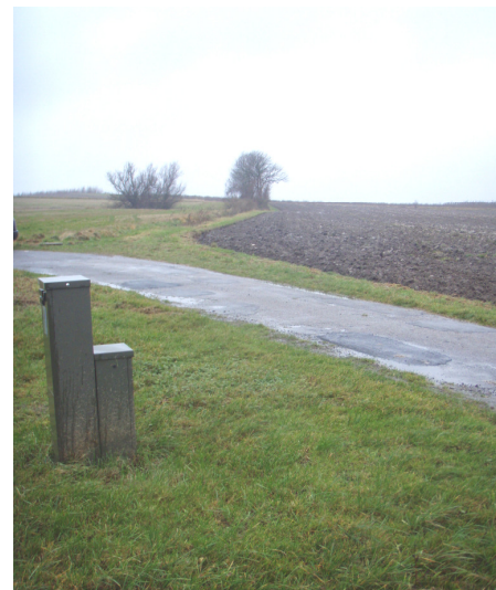
Den nye trampesti fra Kirkemosevej til Stege