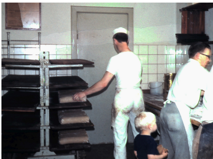
Svendene slår rugbrød op – og den lille hjælper ser interesseret til