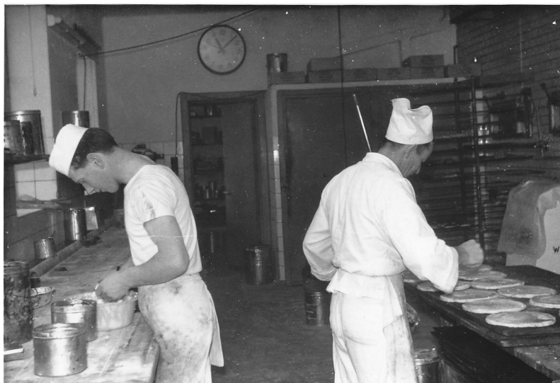
Bagemester (Guttes far) og svend