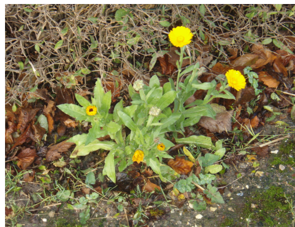
Morgenfruer på fortovet på Udbyvej lyser oppe i den mørke december tid.

Storegade 29 • 4780 Stege • Tlf 55 86 15 00 • Fax 55 86 15 55 www.moensbank.dk