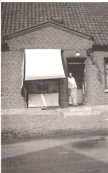
Rødled Bageri og bagermesteren