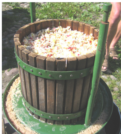
Udlejning af æblepresser