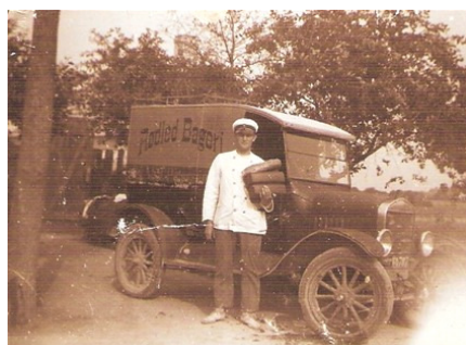
Bageriet i Udby var kendt for sit rugbrød