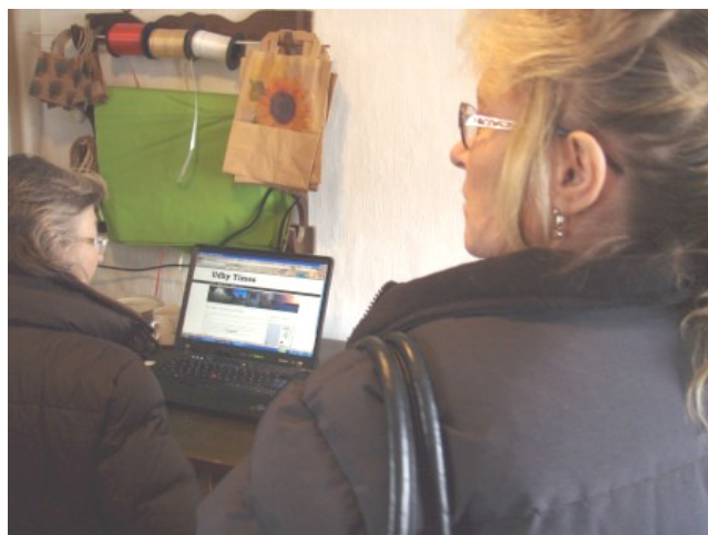
Udby Times hjemmeside blev fremvist.