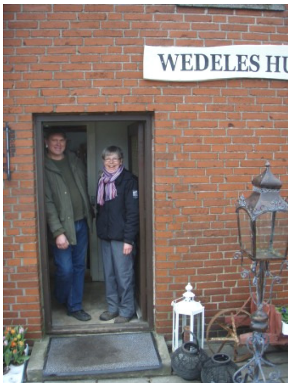
Flere landsbyborgere kiggede forbi Wedeles Hus den dag