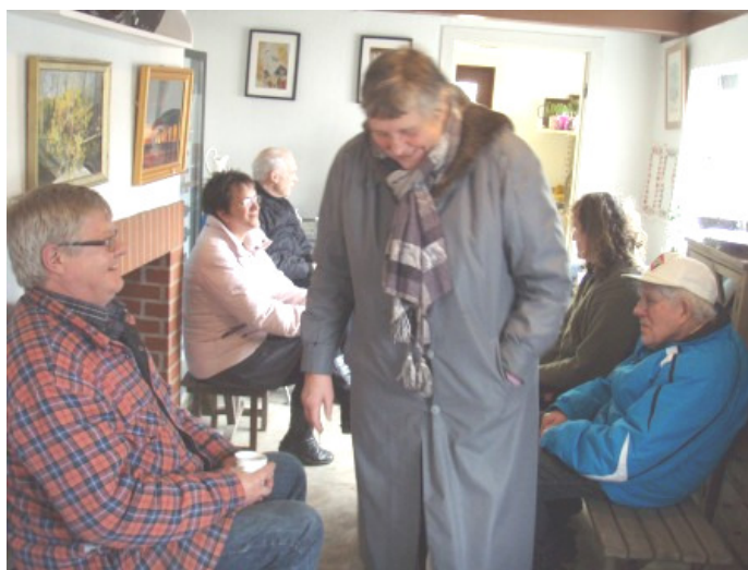
På en rå kold marts dag, var der ild i kakkellovnen og hygge i huset.