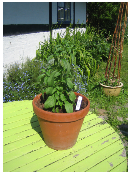
Stevia, en brasiliansk urt