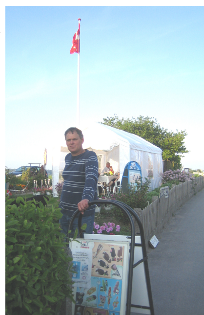
Dagen var d. 30 maj, vejret var 24 grader og fødselaren blev 50 år.