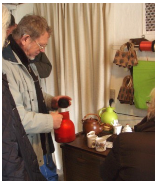
Gratis te og kaffe til alle og lidt til den søde tand.