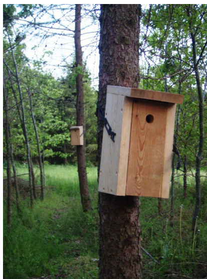
Nye fuglekasser i Udby Skov

Skoven er efterhånden vokset godt til, der har været udtyndinger, der er flere grupper som har sat fuglekasser op, bla. Udbyborgere, der er folk fra landsbyen, som på eget initiativ slår græsstier rundt om bl.a. en af de små søer tæt på landsbyen, der er den lille skov hvor alle må