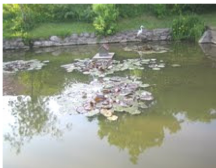
Åkander i gadekæret

Gadekæret nr. 1 (med det røde stakit ) blev rensat den 18. maj af frivillige fra Udby Landsby Laug.