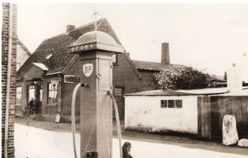
Rødled Bageri set fra benzinpumpen ved Brugsforeningen på hjørnet af Udbyvej