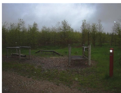
Ved Aktiv Skov basen ved Dirkvej ses udtyndingen tydeligt