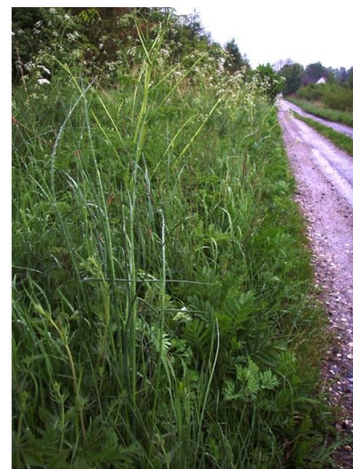
Du kan plukke vilde løg på Bodshøjvej mellem grusvejen og skovkanten

Og når I så er derude kan I være heldige at høre de grønne frøer som kvækker ved fx søerne ved Kirkemosevej og ved Bodshøjvej.