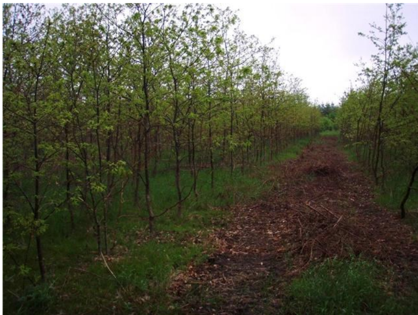
Udby Skov er blevet udtyndet i vinter

Hen over vinteren har der været dage hvor det har larmet fra Udby Skov.