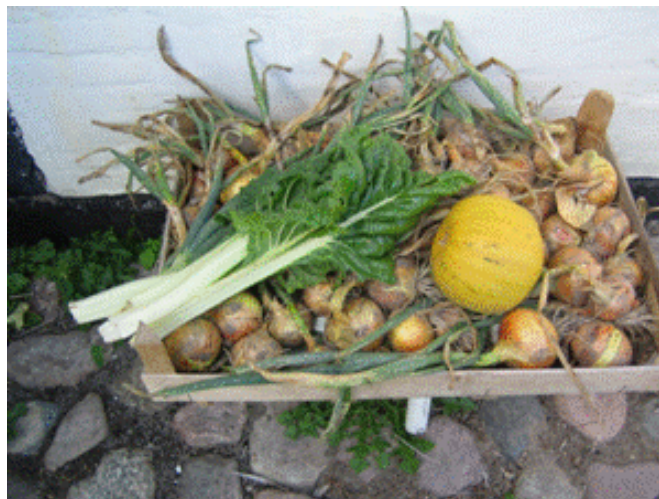
Vis din bedste høst eller skæggeste gulerod

Der er søgt og bevilliget økonomisk støtte fra Nordea til mad og musik specielt til festen.