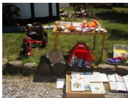
Mange børns legetøj skiftede hænder denne dag.

Ved aktionen blev der doneret genstande som kom under hammeren, bla. Kom Niels Fugl fra Udbygade 12, med en flot gammel antik vægt som blev solgt for 220,- i alt gav aktionen ca. 1.284 kr. som går til avisen produktionsudgifter så vi kan fortsætte med at uddele avisen gratis til alle landsbyens borgere.