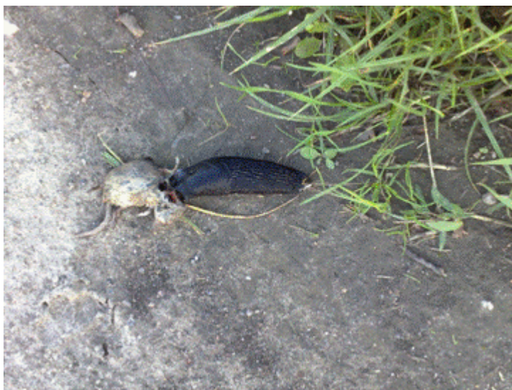
En virkelig dræber :-)

ca. 300 snegle, næste år – hermed en opfordring til alle i Udby: Drøb dem!