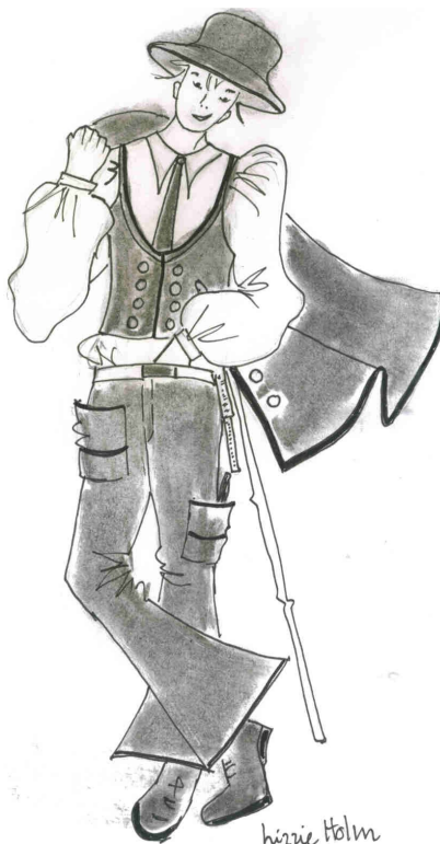
Naver i deres traditionelle tøj

Jeg dukker op på Udbyvej 11, hvor jeg har fået lov til at stille de to Navere spørgsmål i deres frokostpause.