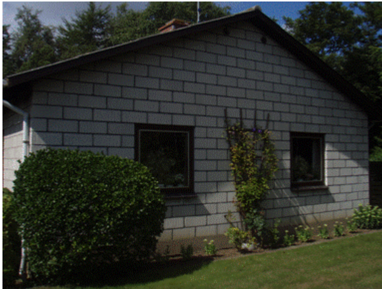
Børge og Ullas hjem i mere end 45 år

Børge har arbejdet i landbruget, 10 år på Sukkerfabrikken og som murerarbejdsmand. Begge fortalt livligt om gangen i lands-