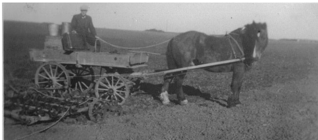
Antonius med kontrolflytning 1948 i Sømarke

På gensyn i Udby Times med 4. indlæg - Antonius