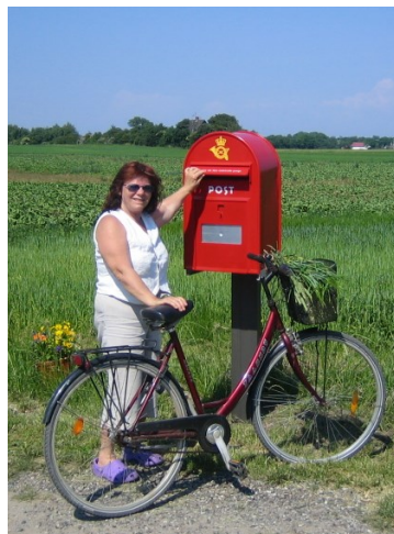
Udby postkasse - døgn åben