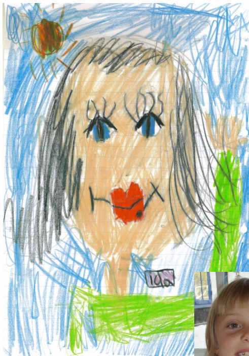
Tegnet af Ida., Udby.

Når der er gode iltforhold vil dyrene trives i vandet, f.x. dyreplankton, salamandre, frøer og insektlarver. Også fisk vil trives, men fisk kan af flere grunde være mere problematisk i et gadekær. Balancen mellem planteplankton, dyreplankton, og rovdyr er meget vigtig for gadekærets tilstand. Fiskene, fx karper,