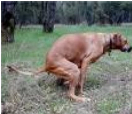
Ovenstående er ikke i orden og bidske hunde heller ikke.

Her må de gå løs Undtagelsen kan være på steder i naturen, hvor et skilt viser at hunden kan