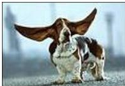
Sjov hund, billede fra internettet

ke en forbedring siden Ugebladet havde bragt brevet. "Nogle få viser mere hensyn nu, men der er også