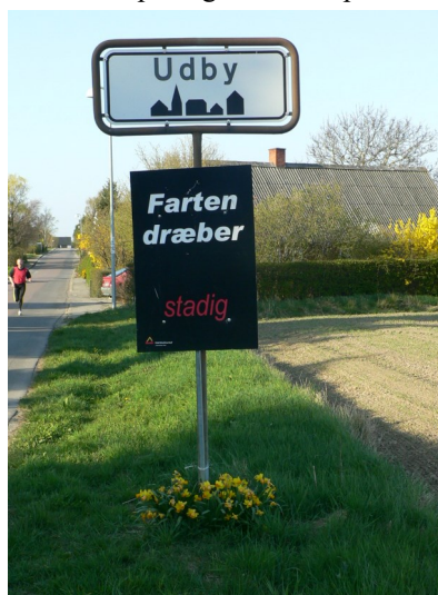
Blomster under landsby skilt på Udbyvej

Som et led i vores overordnede strategi for at forbedre trafikikkerheden har trafikikkerhedsudvalget startet et "forskönnelse af landsbyskiltene" projekt. Det går ud på at gøre mere op-