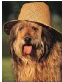
Sød vovse, billede fra internettet