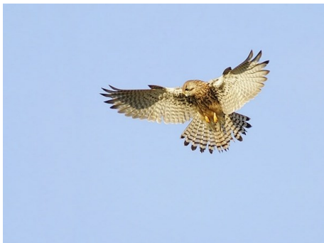
Tårnfalk – musende