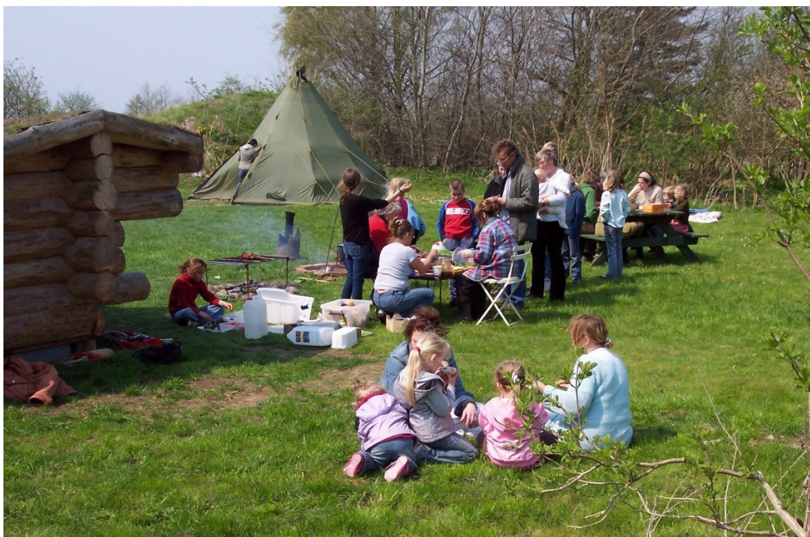
Billed fra sidste år—forberedelse af rådyrburgere.

Indgangen til Mosehældgård i Udby Skov er fra Trehøjevej, hvor der også er parkeringspladser.